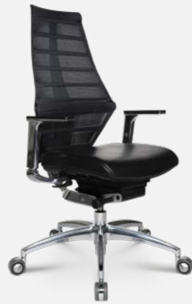
W5 - 1