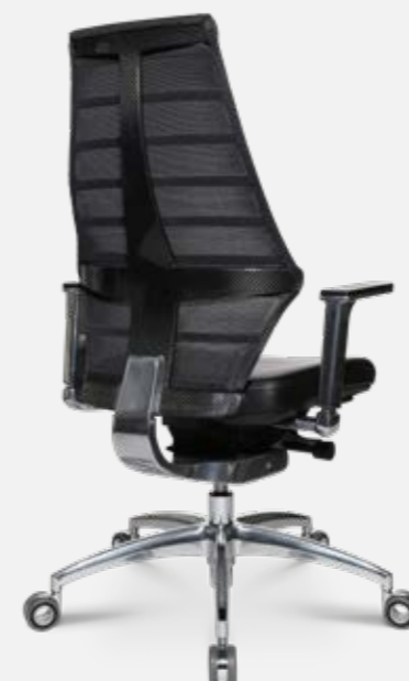
W5 - 1

W5 - 1 Setzt Akzente in jedem Raum. Sitzfläche in vielen verschiedenen Farben erhältlich.