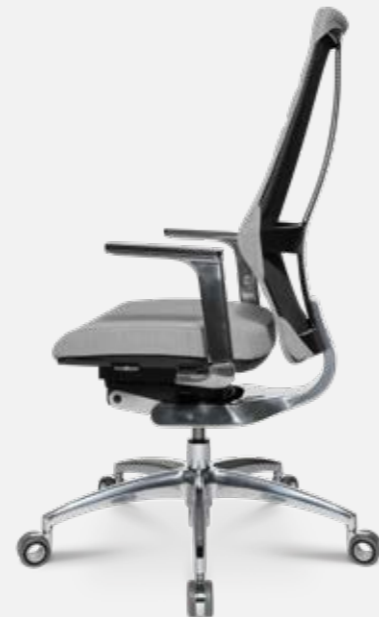
W5 - 2