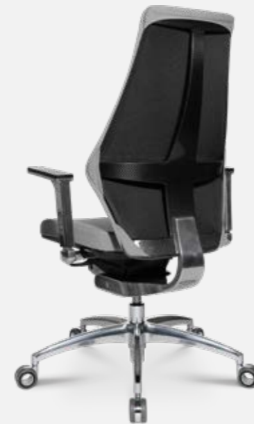
W5 - 2

W5 - 2 Der Allrounder passt sich überall an. Sitz und Rückenlehne in verschiedenen Farben und Steppungen verfügbar.