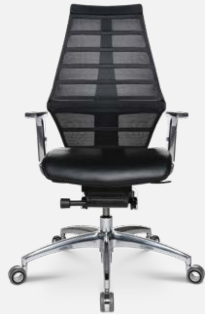
W5 - 1