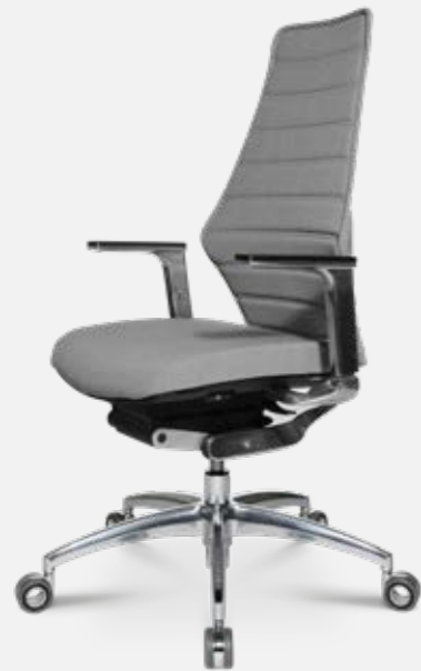
W5 - 2