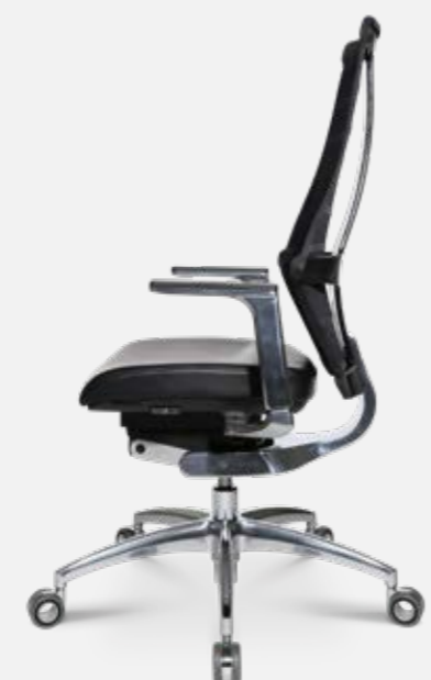
W5 - 1