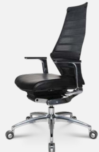
W5 - 1