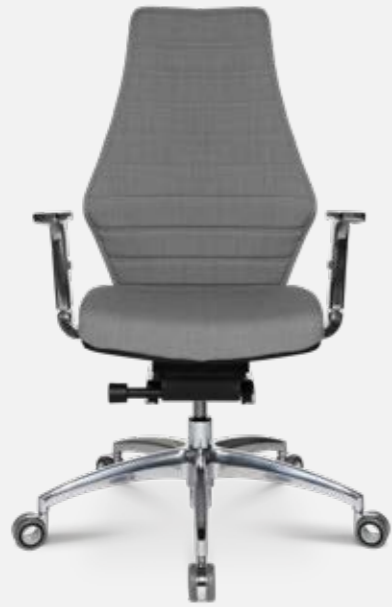
W5 - 2