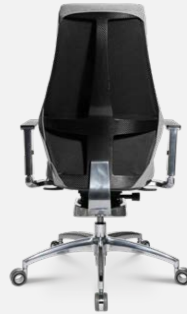
W5 - 2