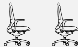
W5 - 1

W5 Discover the future even now – first carbon office chair by WAGNER. Developed in cooperation with specialists from the carbon industry, modern technologies are used in this model. The ultrathin backrest made of extremely hard carbon, gives the W5 a delicate and light appearance. The backrest, consisting of a high-tech 3D fabric, is only suspended on six points and stretched over the backrest. In this way, the backrest optimally adjusts to the user, but in no way restricts its mobility.