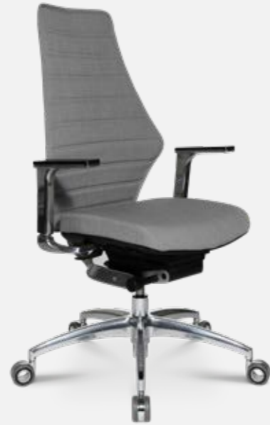
W5 - 2