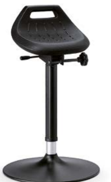
9454 / 9454E