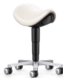
9473E / 9473L / 9473R