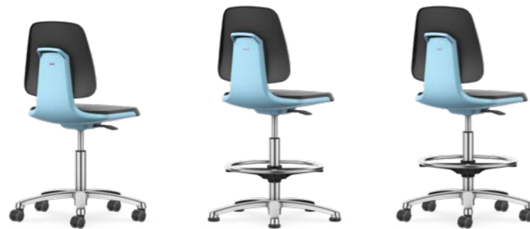
9123 / 9123E