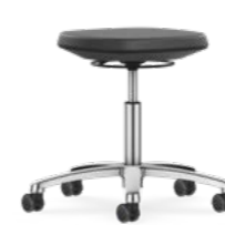
9127 / 9127E