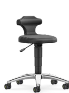
9408 / 9408E