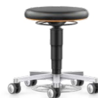
9F63L / 9F63R