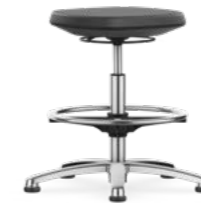
9122 / 9122E