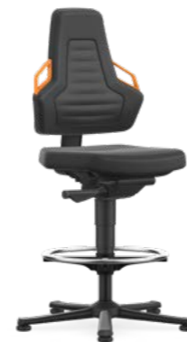
9031 / 9031E