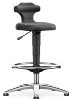
9419 / 9419E / 9419R