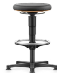
9461 / 9461E / 9461L / 9461R