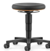
9463 / 9463E / 9463L / 9463R