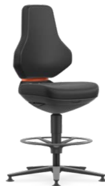
9171 / 9171E