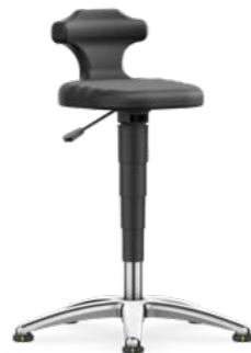
9409 / 9409E