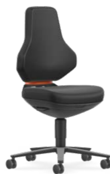
9173 / 9173E