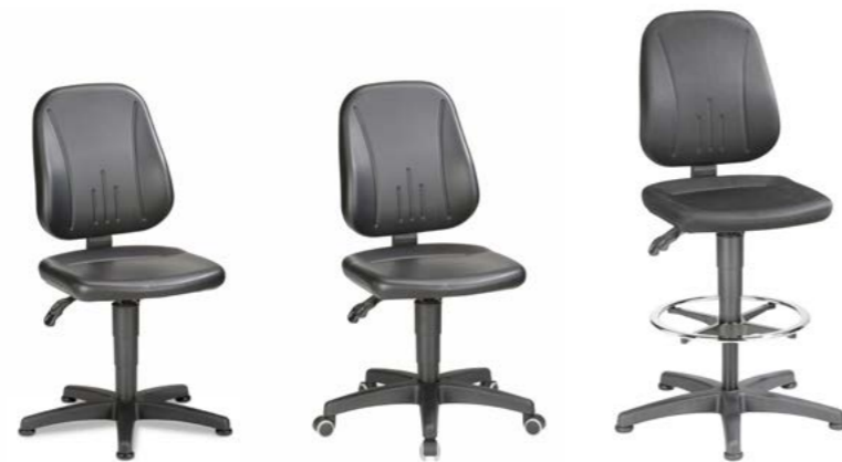
9650 / 9650E