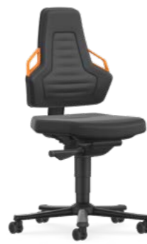
9033 / 9033E