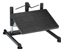
9455 / 9455E