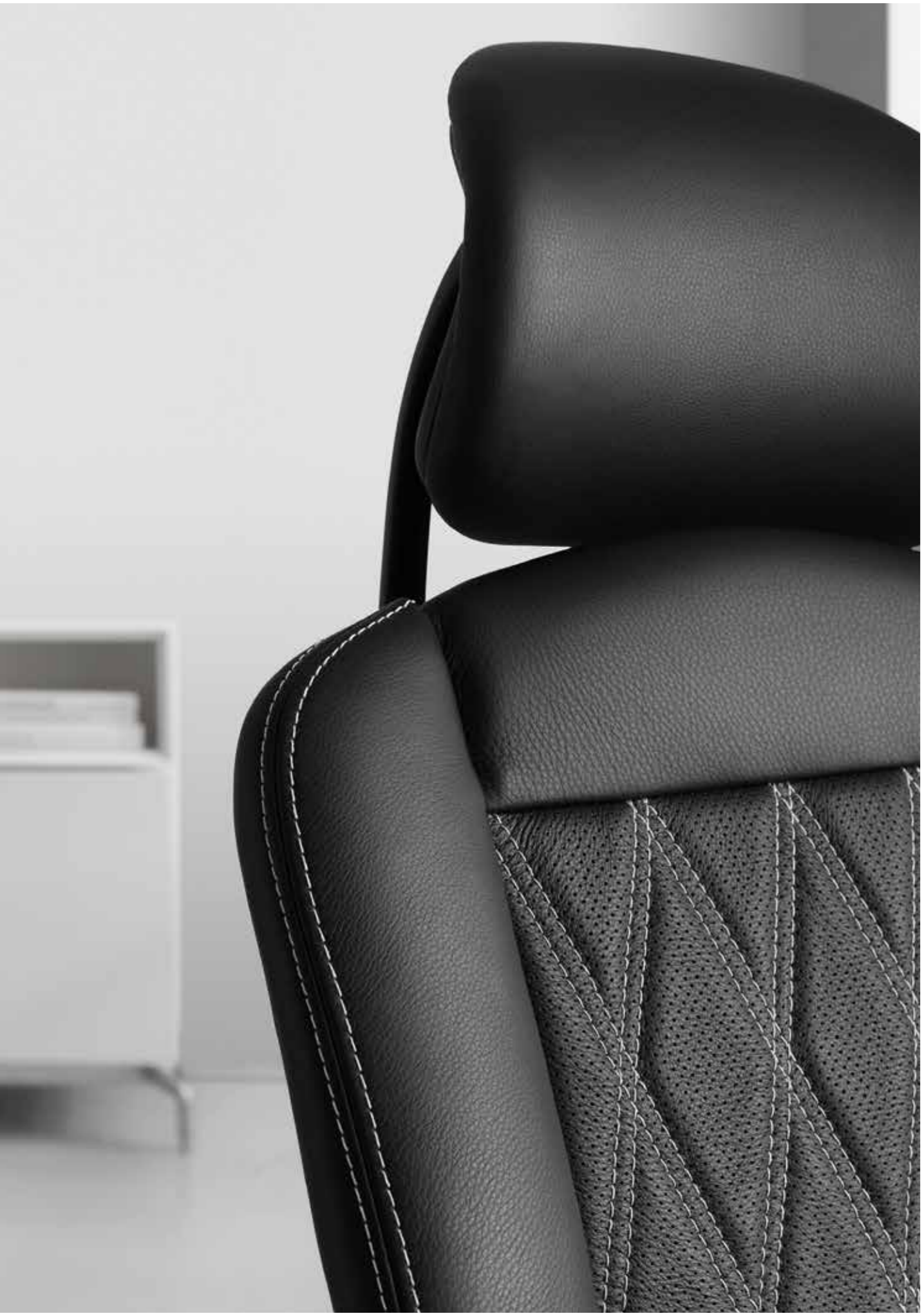
Wagner-Feeling pur in traditioneller Handarbeit! Die Liebe zum Detail verleiht unseren Sitzmöbeln einen ganz besonderen Wert. Wagner-Feeling 100% traditional hand made. The love for details gives our furniture the special touch.