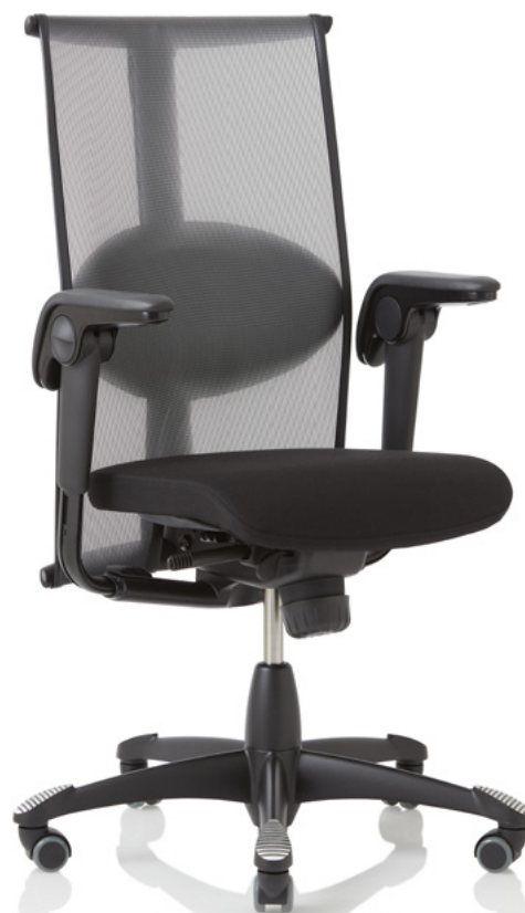
Design: Svein Asbjørnsen/sapDesign®. Patent- und Designgeschützt.