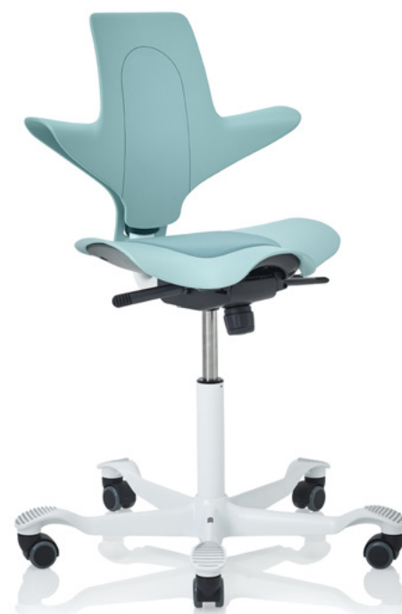
Design: Peter Opsvik. Patent- und Designgeschützt.