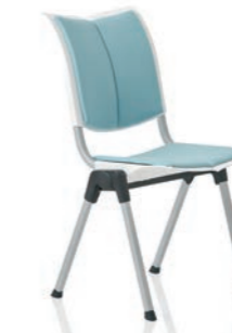
HÅG Conventio Wing 9831