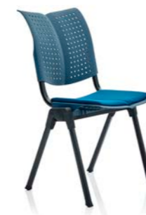
HÅG Conventio Wing 9821