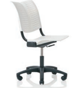
HÅG Conventio Wing 9812