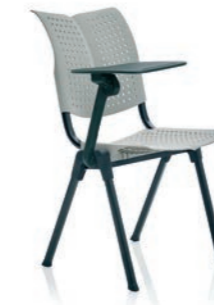
HÅG Conventio Wing 9811 mit Schreibtblett