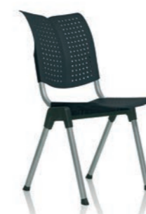
HÅG Conventio Wing 9811