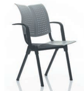
HÅG Conventio Wing 9811 mit Armlehnen